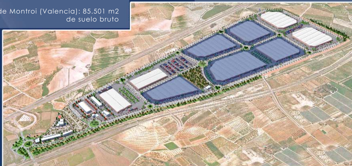
POLÍGONO INDUSTRIAL VALPARCK - VALLADA

El Melero II de Utiel (Valencia): 213.832 m2 de suelo bruto