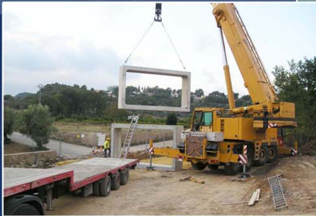
Ejecución obra de paso