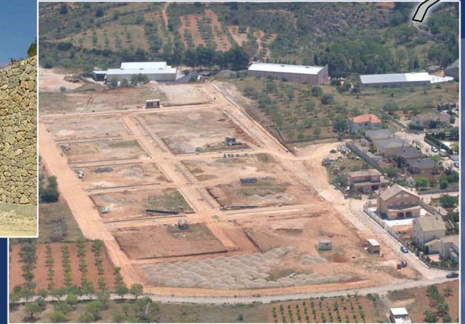
Ejecución P.A.I "El pantanillo" en Siete Aguas