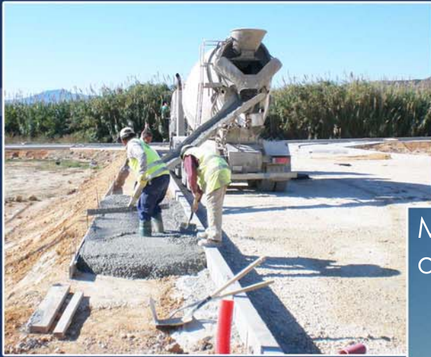
Muro de mampostería ordinaria