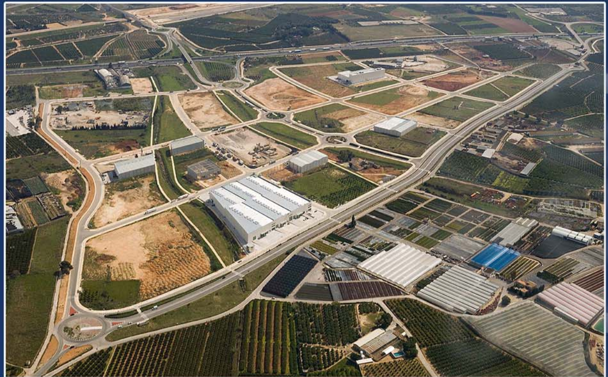
POLIGONO INDUSTRIAL SUZI I - PICASSENT