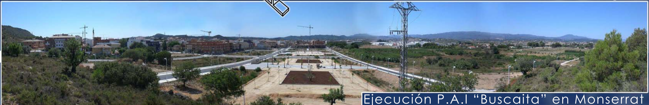
Ejecución P.A.I "Buscaita" en Monserrat